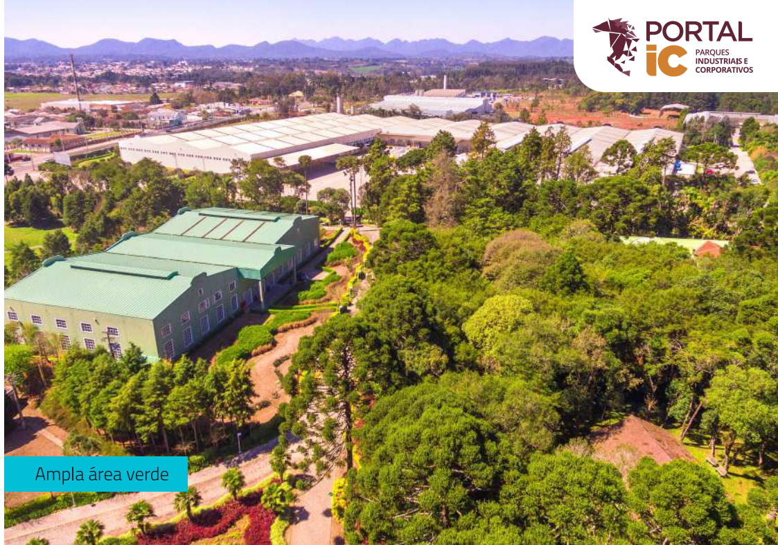
Ampla área verde