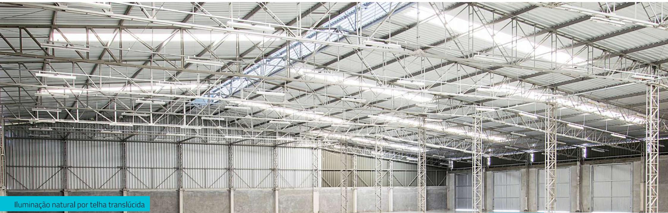
Iluminação natural por telha translúcida