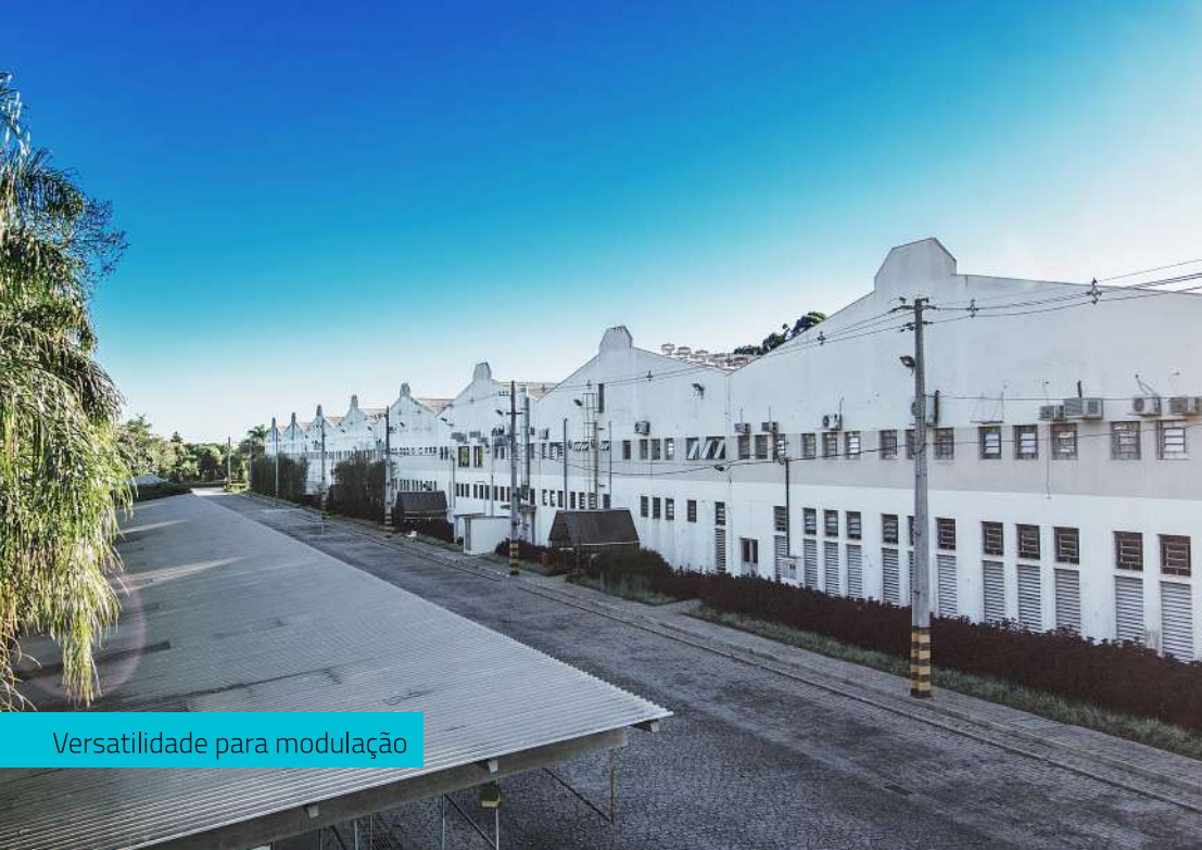
Versatilidade para modulação