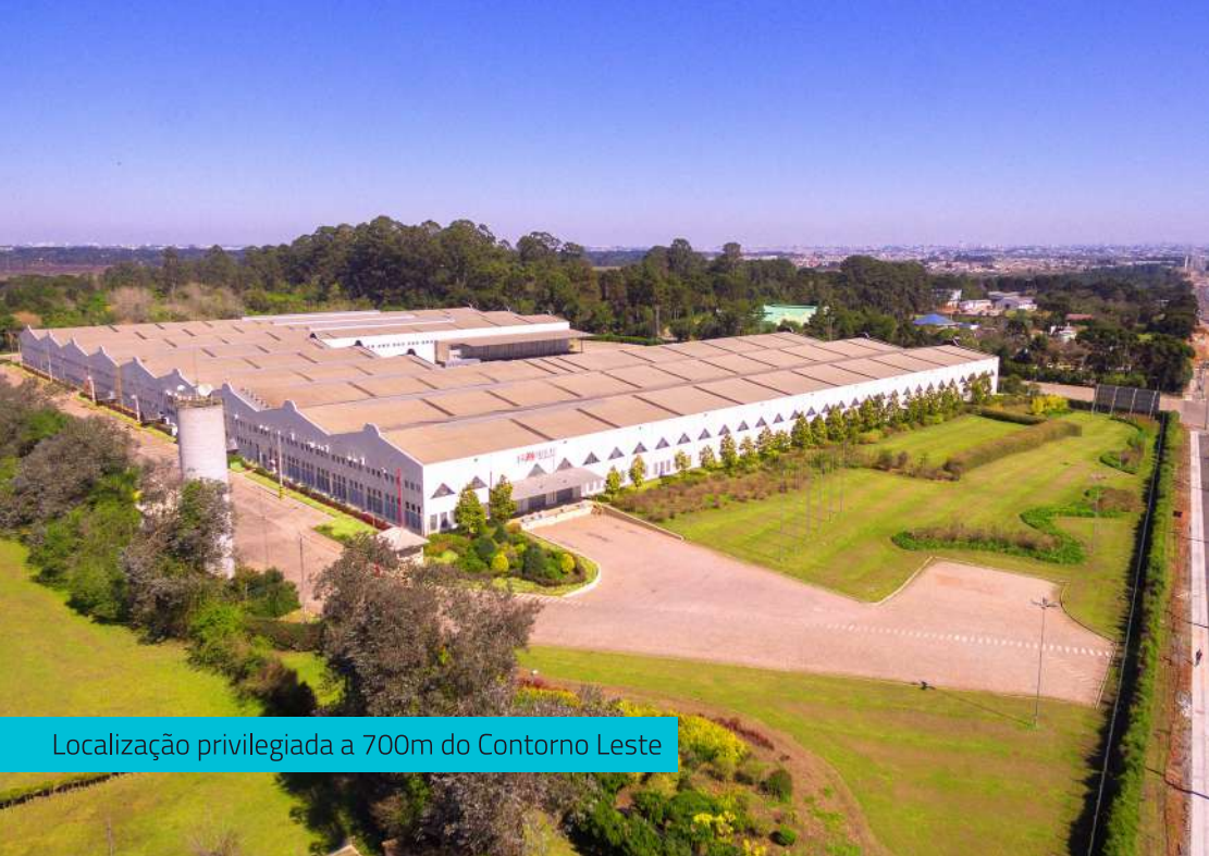
Localização privilegiada a 700m do Contorno Leste