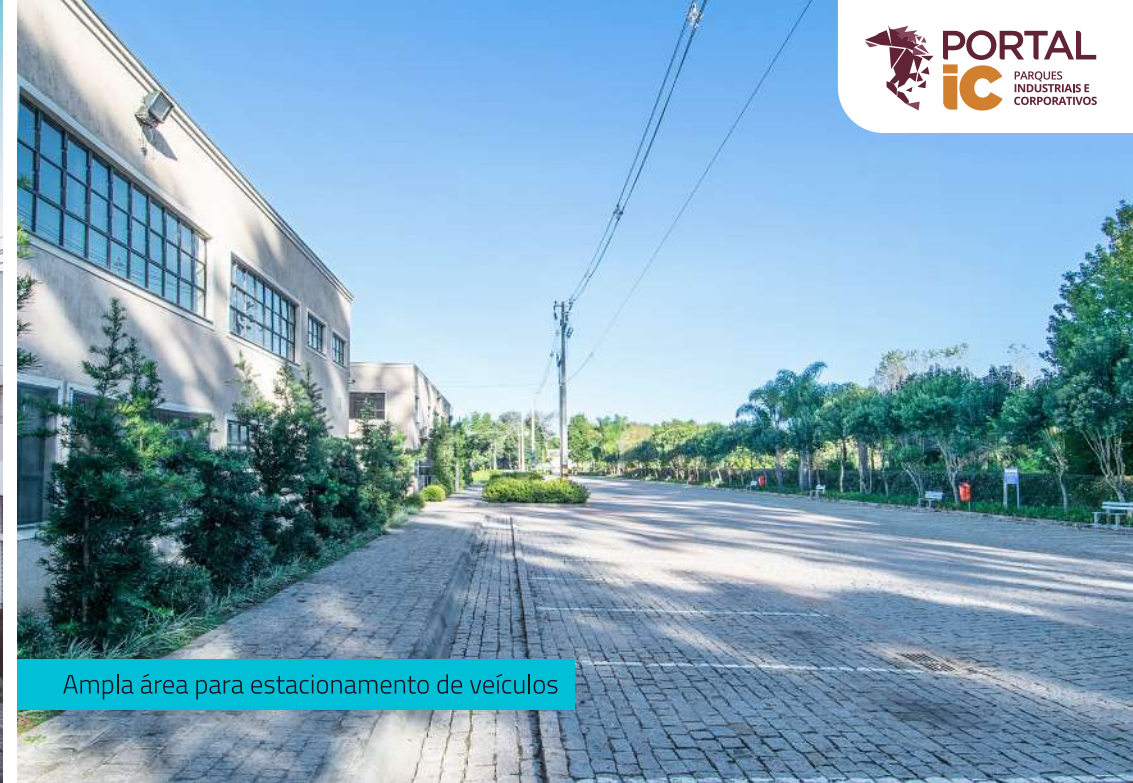
Ampla área para estacionamento de veículos