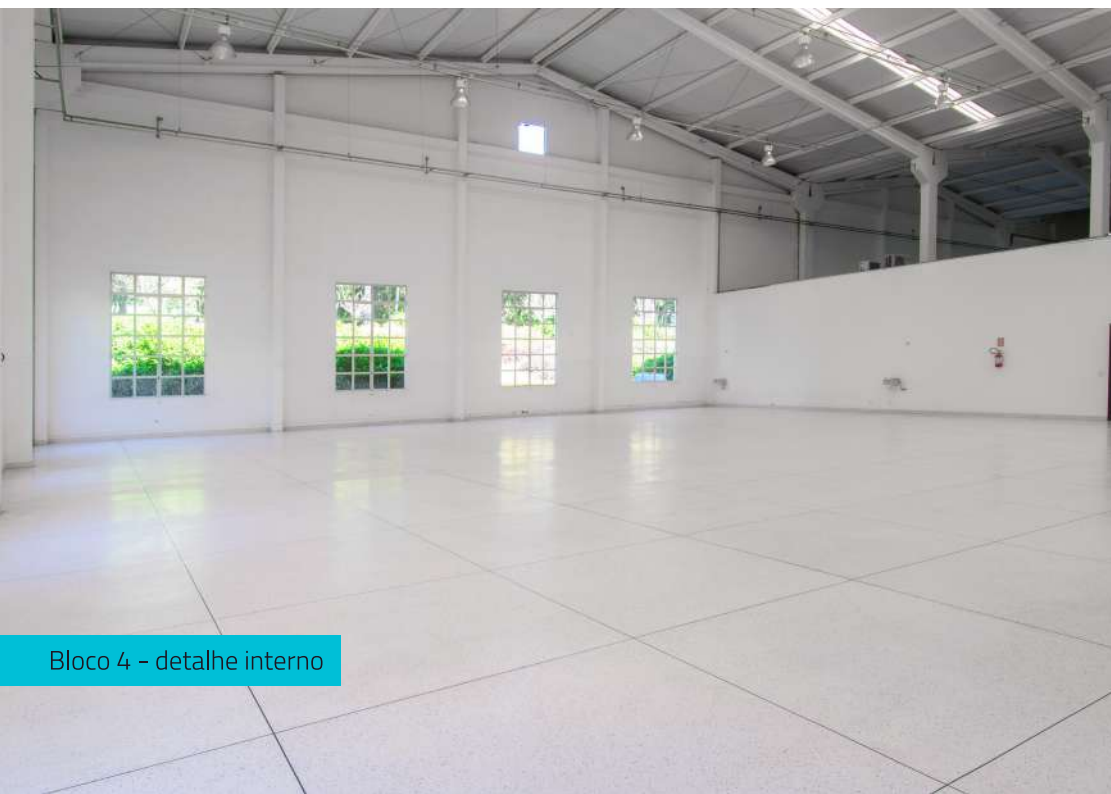
Bloco 4 - detalhe interno