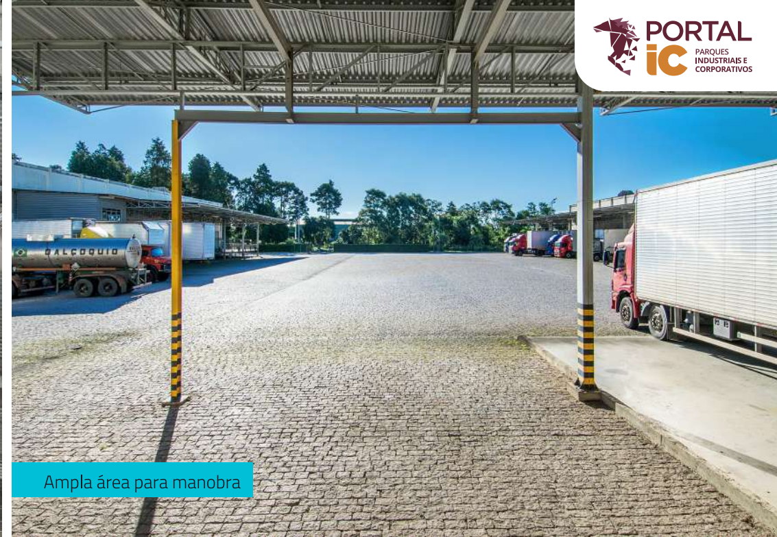
Ampla área para manobra