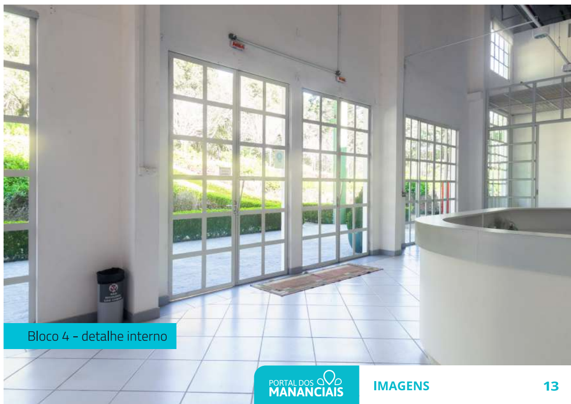
Bloco 4 - detalhe interno