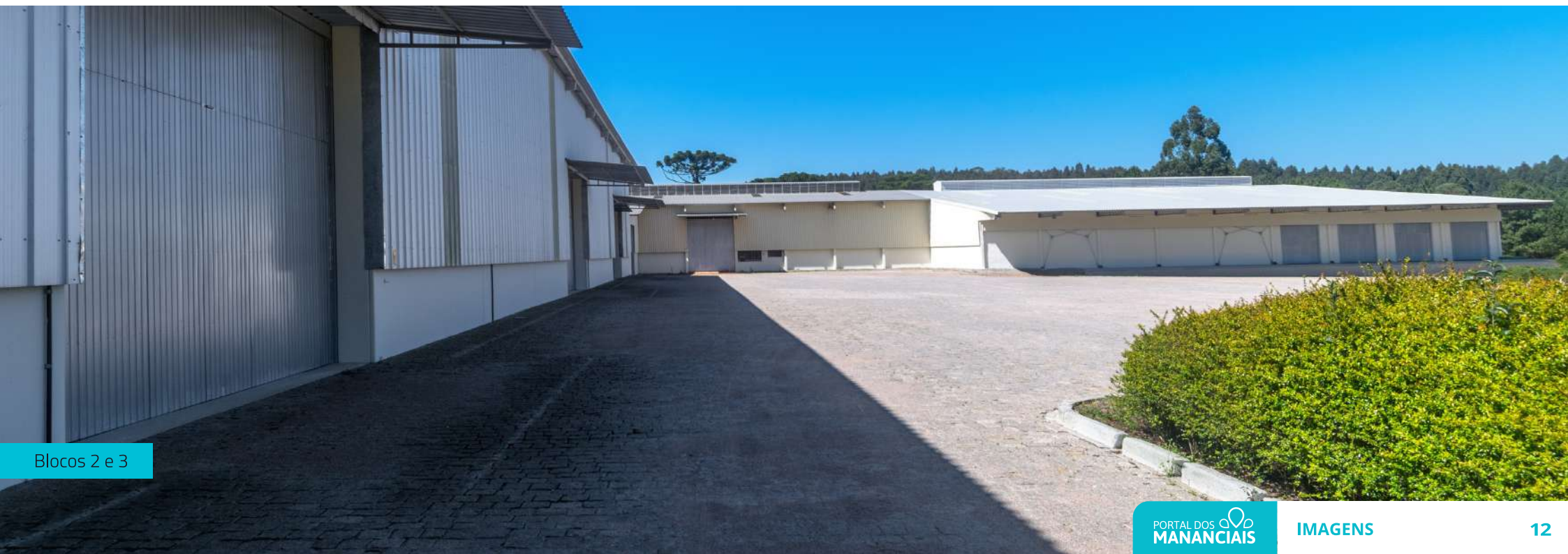
Blocos 2 e 3