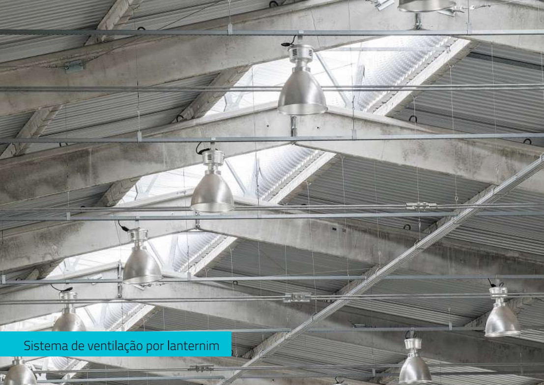
Sistema de ventilação por lanternim