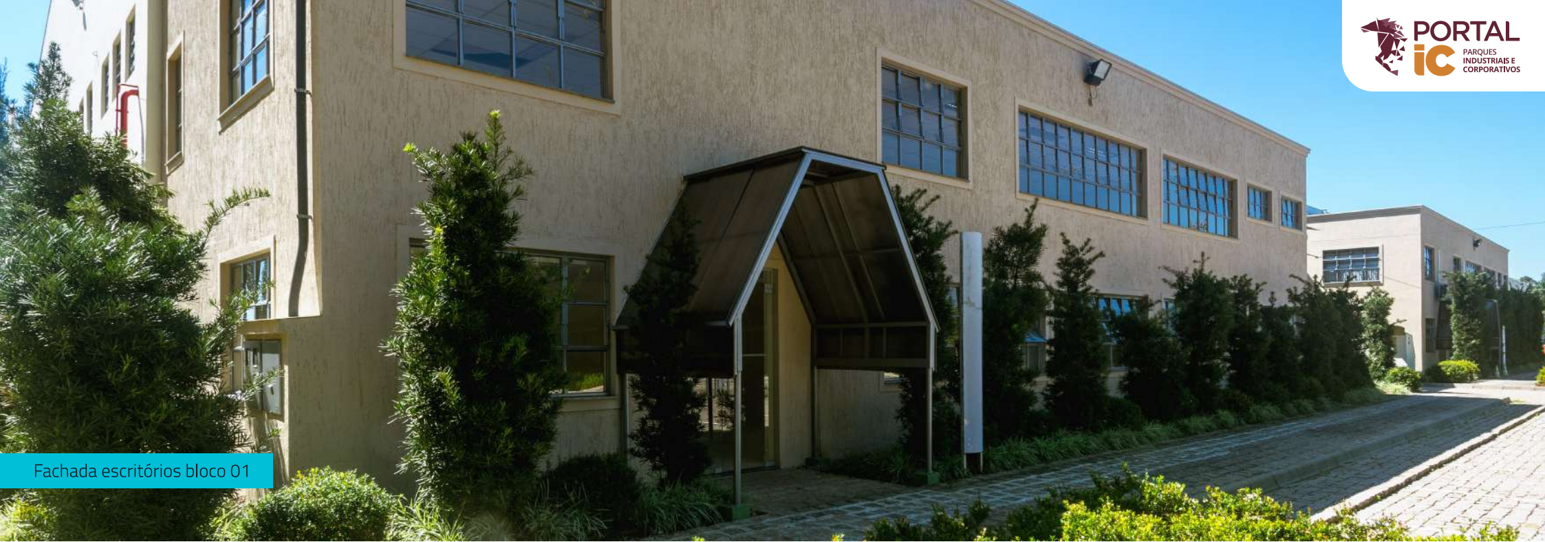
Fachada escritórios bloco 01