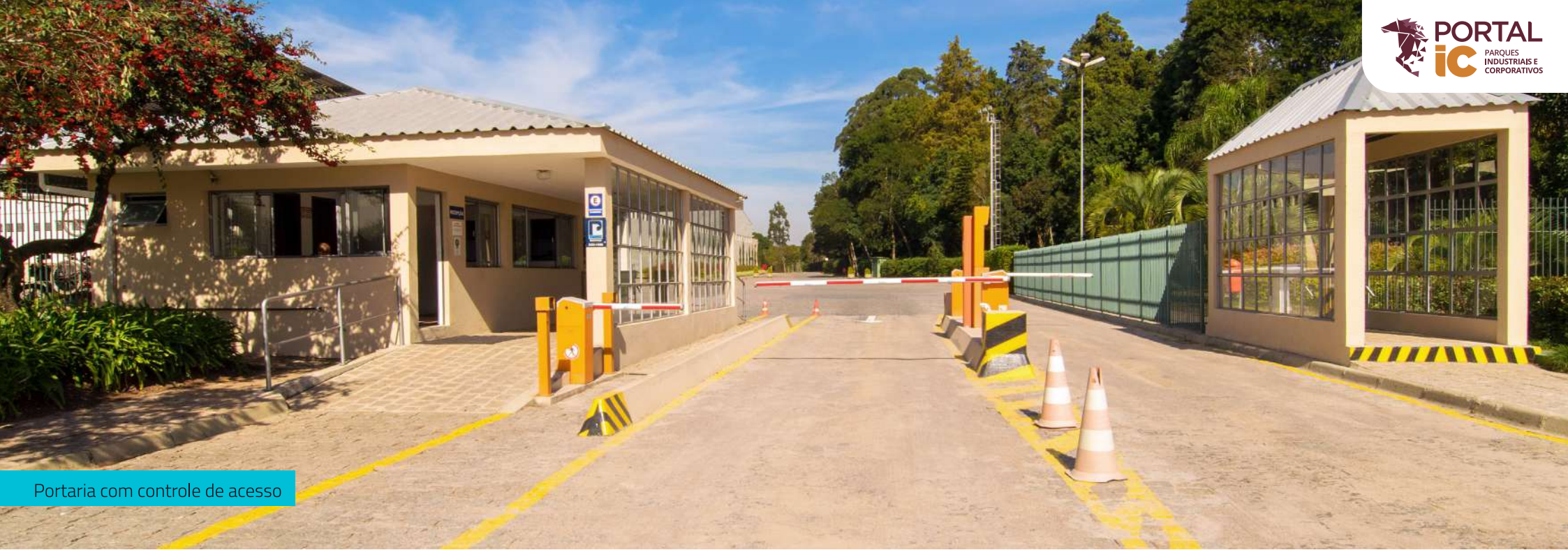
Portaria com controle de acesso