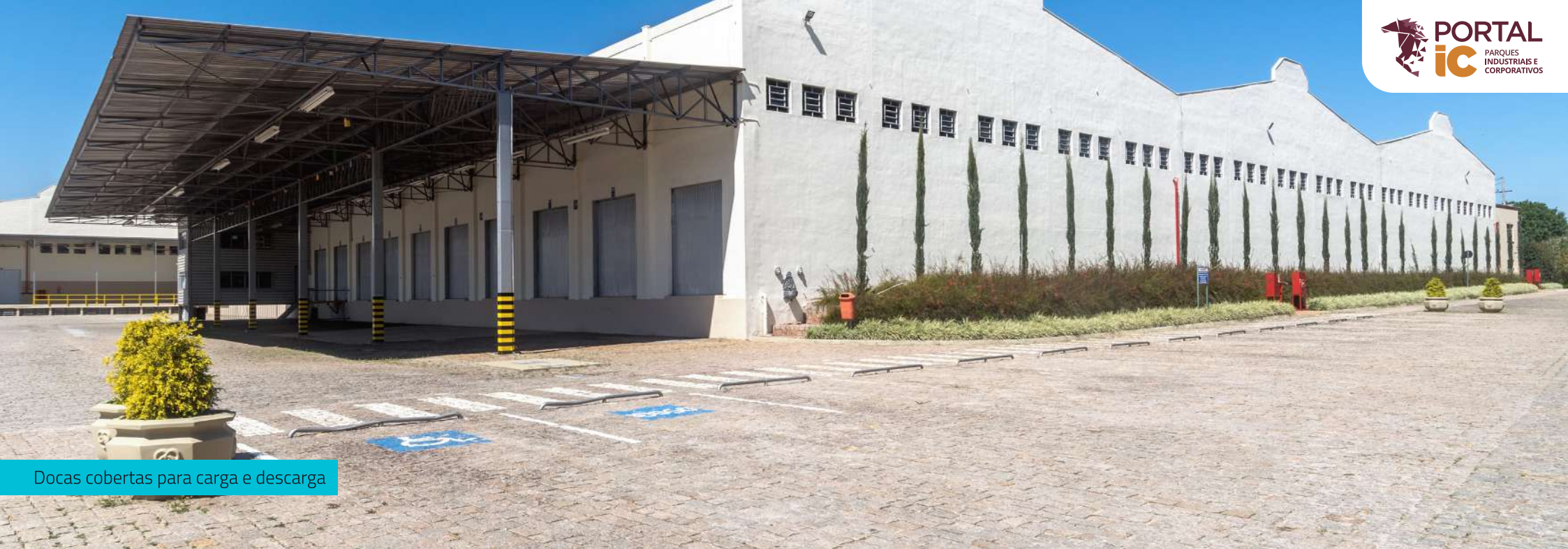
Docas cobertas para carga e descarga