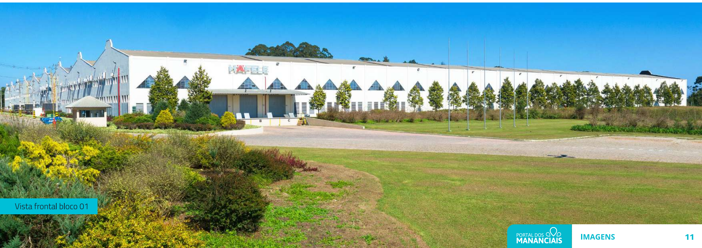
Vista frontal bloco 01